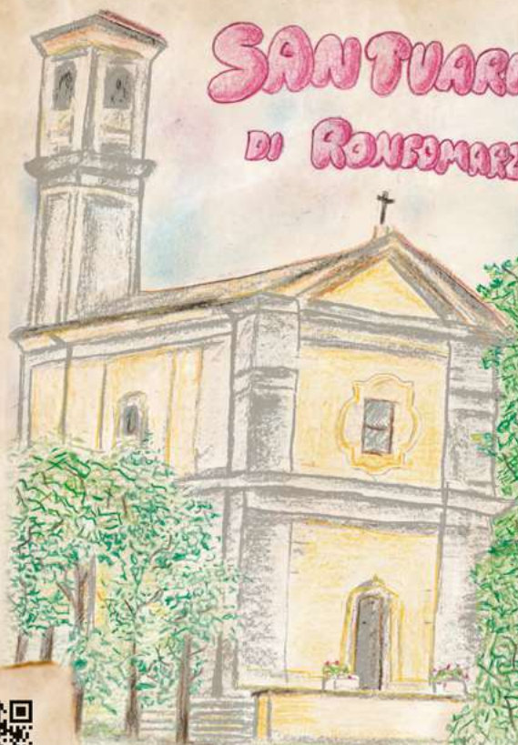
Immagine della Beata Vergine che si venera nel Santuario